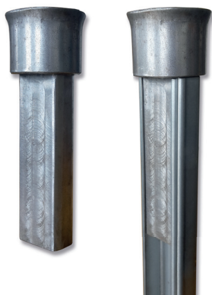
Zatlačovač AGP po nasunutí na sloupek před zatlačováním